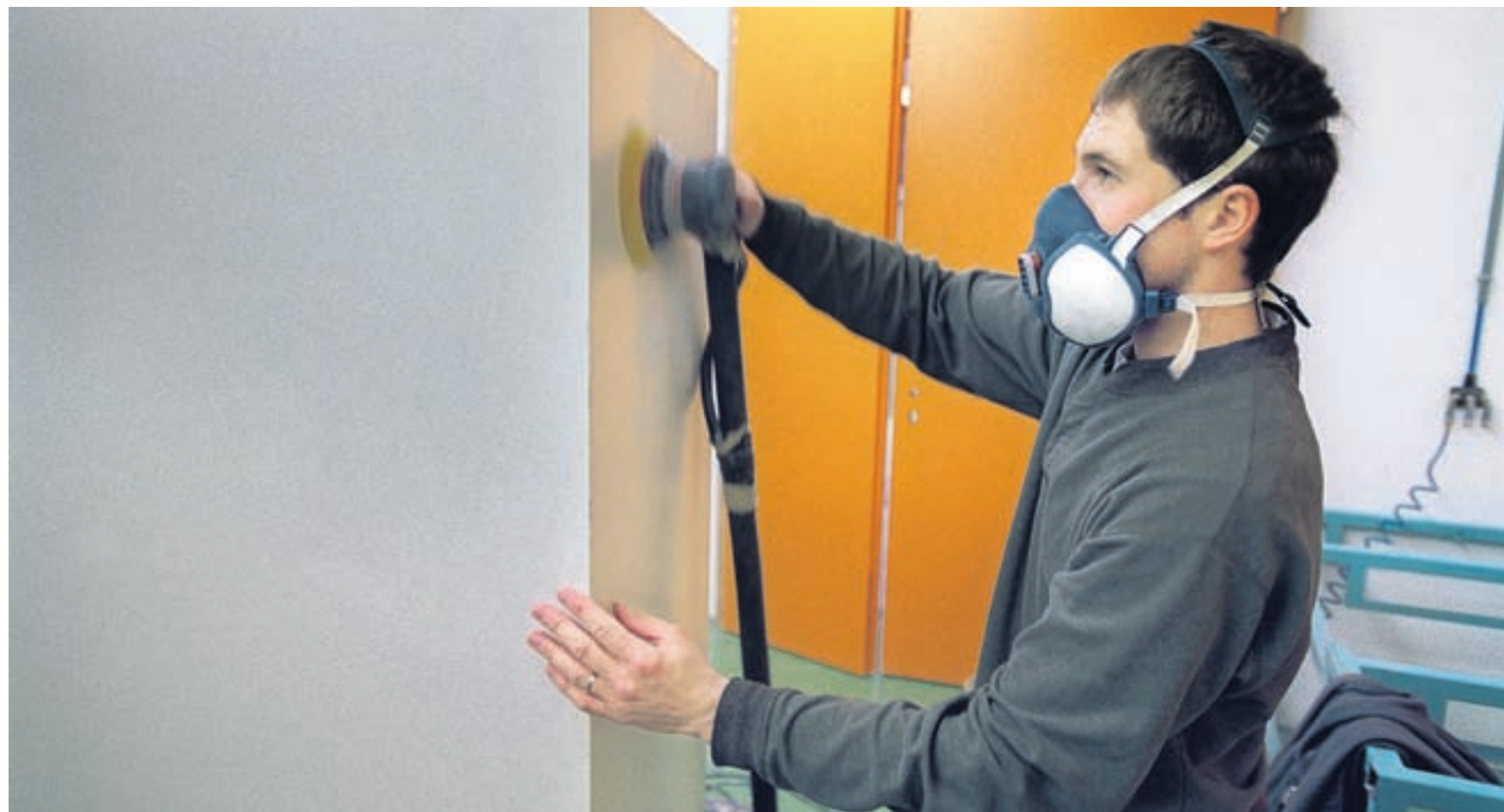
Botschaft an die Jugend. Der Weg an eine Hochschule ist für einen Handwerker genauso offen wie für einen Gymnasiasten.

Politik und Gewerbe rühren die Werbetrommel für die Berufsmatur