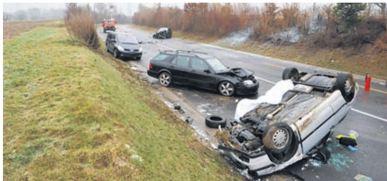
Bild des Schreckens. Am Montagmorgen um 6.35 Uhr kam es zur tödlichen Kollision.

25-Jähriger starb bei Frontalkollision auf der Bruderholzstrasse zwischen Münchenstein und Bottmingen